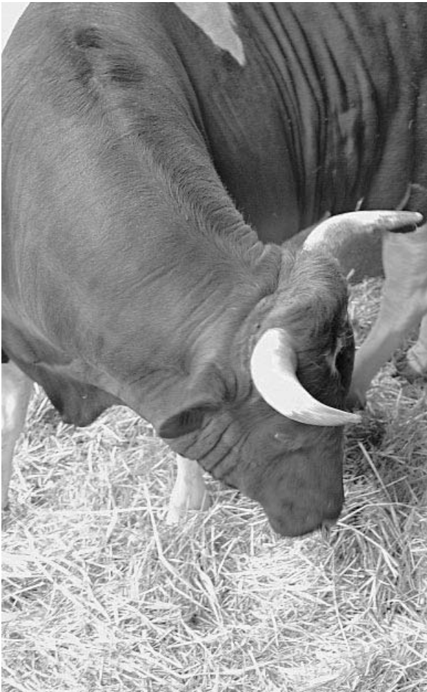
Stier vom Bauckhof

samten Ernährungsvorgang sich auf den Menschen übertragen. Sehr viel weniger als man gewöhnlich annimmt, bilden die Stoffe selbst den Leib des Menschen. Die Kräfte aber, die aus den Nahrungsmitteln gewonnen werden können, dienen vor allem zur Bildung eigener Körpersubstanz. Dies läßt sich sehr gut an dem komplizierten Beispiel der Rinderhörner beschreiben.