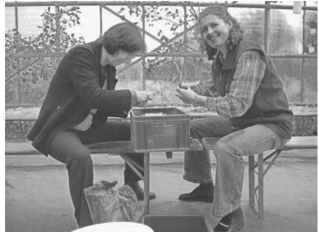
Die Kartoffelschälerinnen

Einige Unentwegte aßen noch von den Resten. Viele standen zusammen und sprachen miteinander. Es konnten allerlei Kontakte geknüpft und Erfahrungen ausgetauscht werden, und zurück blieb der Eindruck, daß dies nicht die letzte Veranstaltung dieser Art war.