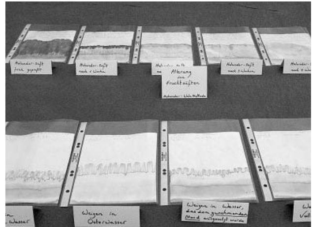
Qualitätsermittlung von Nahrungsmitteln

Es muß oft erst ein optimales Steigbild für jede Pflanze und jeden Pflanzenteil herausgearbeitet werden. Dazu müssen Saftmenge, Saftkonzentration sowie Menge und Konzentration der