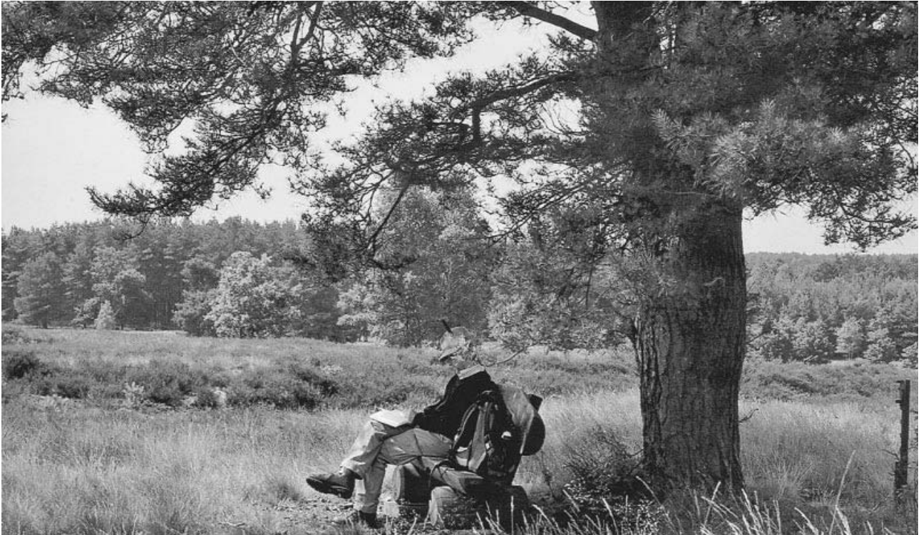
Der Dichter und sein Baum