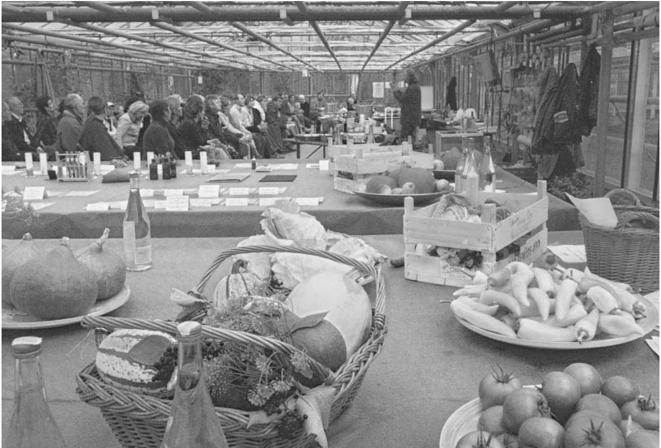
Ernährungsseminar im Gewächshaus

Schauen - Essen - Denken in der Demeter-Gärtnerei Sannmann